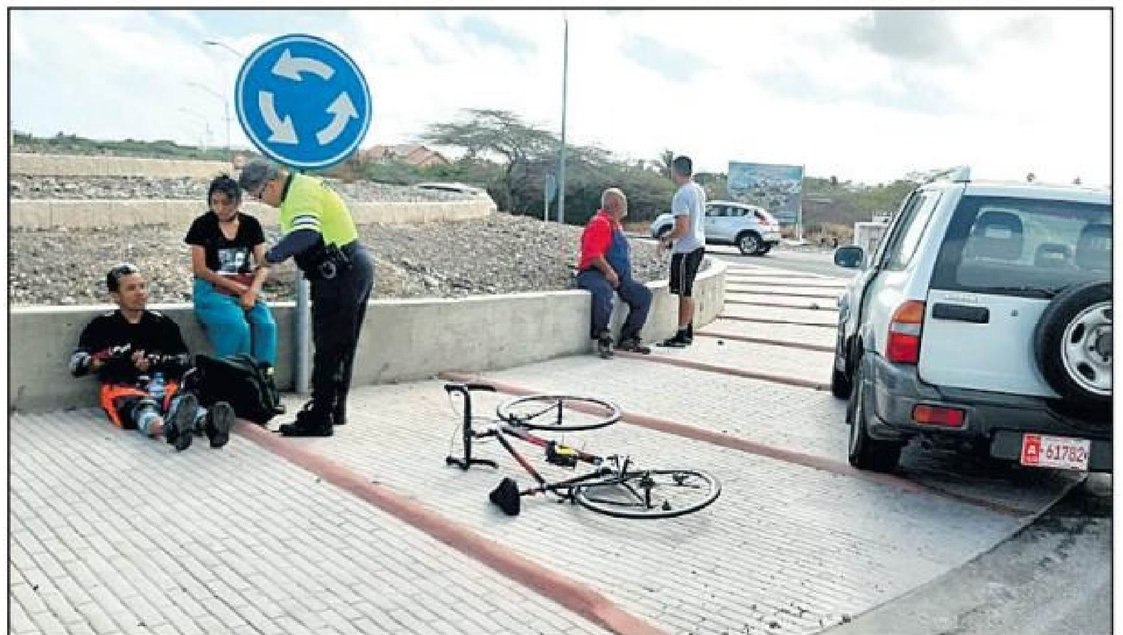
Rotonde Super Food - Diasabra mainta pa mas o menos 8:50 polis y ambulance a wordo informa cu auto lo dal un ciclista na e rotonde di SuperFood.

Na yegada di polis enberdad nan a topa cu e cabayero ciclista herida sinta. E la conta polis cu e tawata coriendo su bais